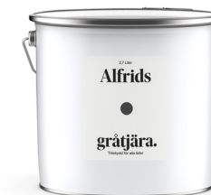
Gråttjära 0,9L Art nr V410051