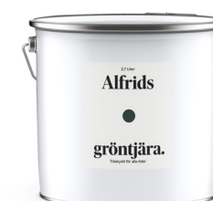
Gröntjära 0,9L Art nr V410071