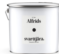
Svarttjära 0,9L Art nr V410055