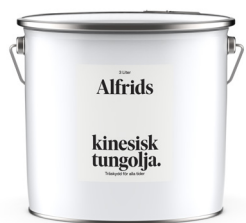
Kinesisk tungolja 1L Art nr V430019