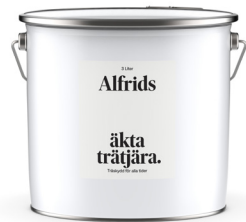
Äkta trätjära 1L Art nr V420011

Grunden i våra traditionella tjärprodukter är trätjären. En naturprodukt som tillverkas av kådrik furuved. Vi har produkter med en lång historia av att skydda trä, så som äkta trätjära som är mörk i färgen, dalbränd trätjära med en fin gyllenbrun kulör och den klassiska blandningen roslagsmahogny. För ytor som trädäck och altaner finns ljus tjärolja.