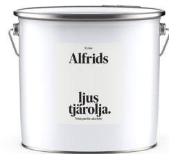
Ljus Tjärolja 1L Art nr V430016