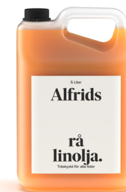
Linolja rå 5L Art nr V710016