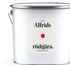
Rödtjära 0,9L Art nr V410059