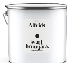
Svartbruntjära 0,9L Art nr V410063