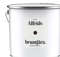
Bruntjära 0,9L Art nr V410067