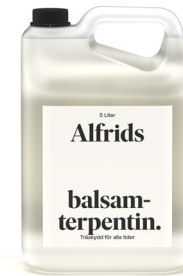
Balsamterpentin 5L Art nr V710012

I likhet med tjära innehåller Alfrids balsamterpentin många komponenter som träet behöver för bästa skydd. Balsamterpentin är en lättflyktig eterisk olja som erhålls genom extraktion ur barrträd.