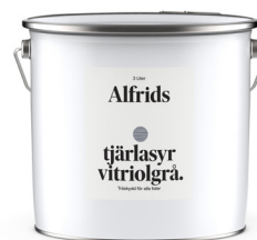
Tjärlasyr vitriolgrå 1L Art nr V430025

Från kådan som skyddar trädet framställer vi tjära. En naturprodukt utan tillsatser som skyddat vikingaskepp och medeltida kyrkor, men som passar lika bra på vår tids mest spännande arkitektur. Alfrids pigmenterade tjärprodukter finns i en rad olika kulörer som ger träet ett vackert uttryck samtidigt som dess naturliga ådring och känsla bevaras.