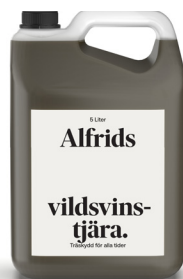
Vildsvinstjära 5L Art nr V420014