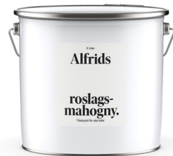
Roslagsmahogny 1L Art nr V430012