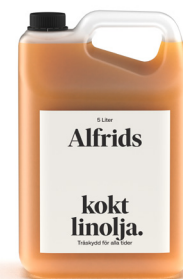
Linolja kokt 5L Art nr V710014