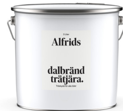
Dalbränd trätjära 1L Art nr V430021